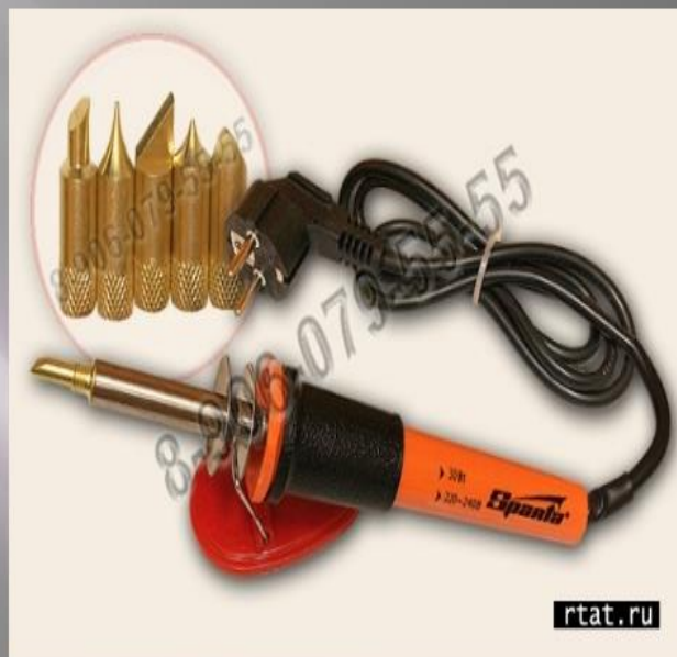
Выжигательный аппарат с насадками